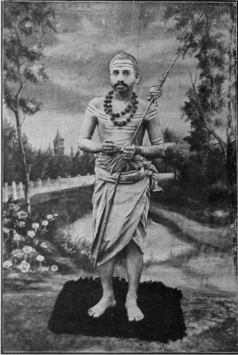
ஸ்ரீ காஞ்சி காமகோடி பீடாதிசுவர ஜகத்குரு ஸ்ரீ சங்கராசாரிய ஸ்வாமிகள் அவர்கள்