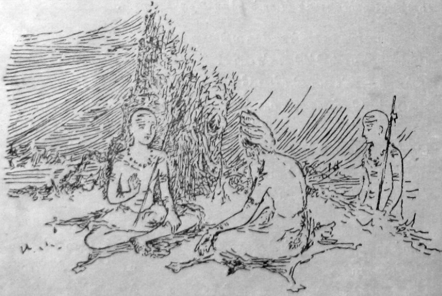
ஸ்ரீ சங்கரரும் வேதவியாஸரும்.

றன. எல்லா மதங்களுடைய பிரதிநிதிகளும் காசி சேஷத் திரத்தில் இருப்பார்கள். அந்தக் காலத்தில் மஹாபண்டிதர்கள் இருந்த ஸ்தானமாக அது இருந்தது. யாத்திரை பண்ணிக்கொண்டே பலபேர்கள் அங்குவந்து தங்கி இருப்பார்கள். நம்முடைய தேசத்தில் எத்தனை ஜாதி, எத்தனை மதங்கள், எத்தனை பாஷைகள் இருக்கின்றனவோ அவ்வளவையும் அங்கே பார்க்கலாம். ஆகையால் அங்கே போய்ப் பிரசாரம் செய்தால் லோகமுழுதும் பிரசாரமாகும் என்று ஸ்ரீ ஆசார்யரவர்கள் நினைத்தார்கள். பல தேசங்களில் உள்ள வைதிகர்கள் அங்கே இருந்தார்கள். அதனால் காசியில் பாஷ்யம் பண்ணினது லோகப்பிரசாரத்திற்கு ஏதுவாயிற்று. அங்கே பல மதஸ்தர்களுடைய கொள்கைகளை நிராகரணம் பண்ணி ஒளபநிஷதமான மதத்தை ஸ்தாபித்தார்.