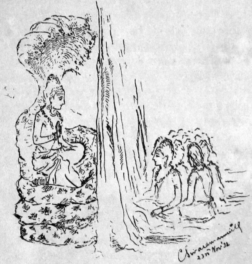
பதஞ்ஜலி மஹாபாஷ்யத்தைச் சிஷ்யர்களுக்கு உபதேசித்தல்.

வியாகரண சாஸ்திரத்திற்கு இவர் செய்த பாஷ்யம் மஹாபாஷ்யம் என்று சொல்லப்படும். 'ஆயிரம் நாப'